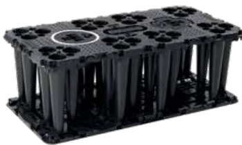
Normaali asennus soveltuu raskaalle liikenteelle