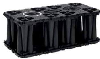
Erikoisluja asennus mataliin peitesyvyyksiin raskaalle liikenteelle ja syviin asennuksiin